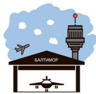
АЭРОДРОМЫ И АЭРОПОРТЫ